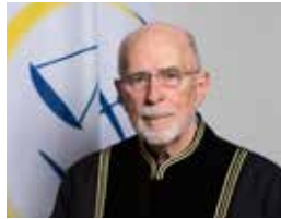
Gjykatës Çarls Smith III (kryesues)