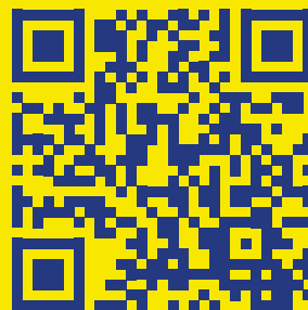
Kalendari i gjykatës