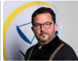
Gjykatës Genël Metro