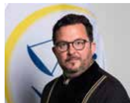
Sudija Genel Metro