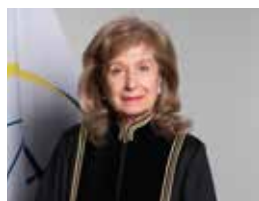
Sudija Ekaterina Trendafilova (predsedavajući sudija)