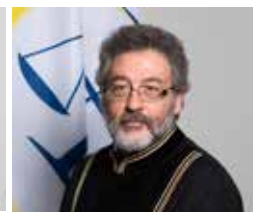
Sudija Žilber Biti