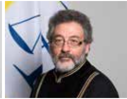
Gjykatës Zhilber Biti