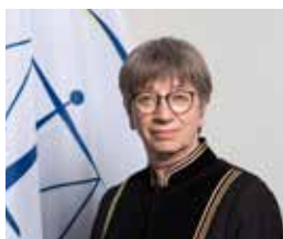
Sudija Mišel Pikar (pred- sedavajući sudija)