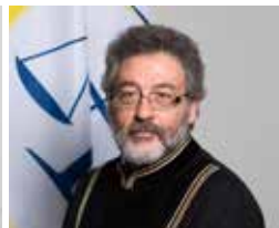
Sudija Žilber Biti