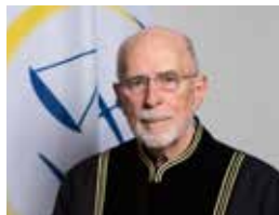
Sudija Čarls Smit III (predsedavajući sudija)