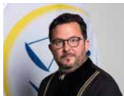
Sudija Genel Metro