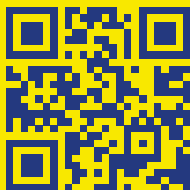
SVK X nalog