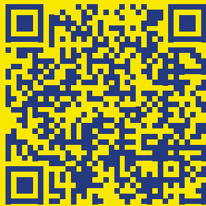
Stranica o predmetu

Za više informacija skenirajte kodove ispod sa kamerom vašeg telefona: